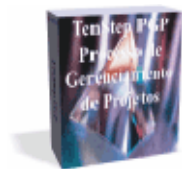
TenStep PGP® Gerenciamento de Projetos