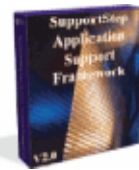
SupportStep™ Gerenciamento da função de suporte (TI)