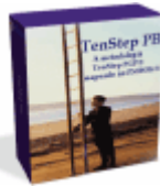
TenStep PB™ Metodologia TenStep PGP® agregada a estrutura do guia PMBOK®.